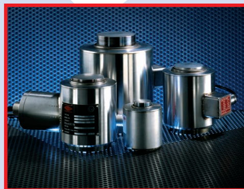
Load cells, analoog of digitaal.

Dit type weegbrug is geschikt voor standaard spoorwijdte (S.R.G. 1435 mm) – rails (standaard) verzonken in het beton dus gelijk aan de bovenzijde van het dek waardoor goed toegankelijk tijdens de keuring met testgewichten. Speciale dek configuraties beschikbaar zoals bijvoorbeeld samengestelde dekken voor het gekoppeld wegen van wagons met verschillende lengtes. Overige capaciteiten en weegvermogens op aanvraag.